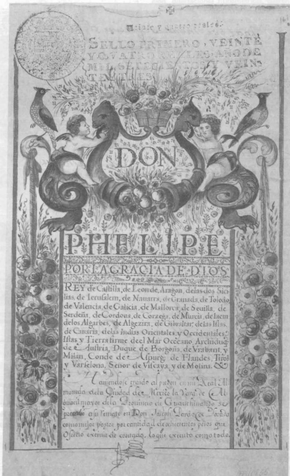
Certificación de venta del oficio de alguacil mayor de la provincia de Guauchinango, 1723. Oficios Vendibles, vol. 9, exp. 8, f. 161 (4 349).

Archivo General de la Nación : Archivo Histórico de Hacienda (8), Ayuntamientos (10), Civil (23), Hospital de Jesús (53), Media Anata (70), Oficio de Hurtado (78), Oficio de Soria (79), Oficios Vendibles (80), Ordenanzas (82), Real Acuerdo (94), Real Audiencia (95), Real Hacienda (98), Reales Cédulas (100), Reales Cédulas y Registro de Fianzas, Depósitos y Obligaciones (102).