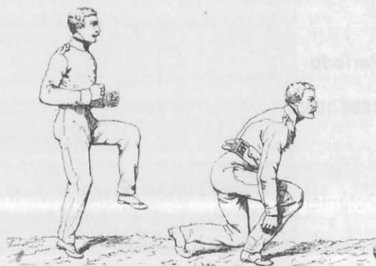
Ejercicios en Ministerio de Guerra y Marina, Decreto e instrucción para la enseñanza de la gimnástica en los cuerpos del Ejército y Guardia Nacional , México, Imprenta de Vicente G. Torres en el Exconvento del Espíritu Santo, 1880. Archivo de Guerra, lám. XIII (detalle).