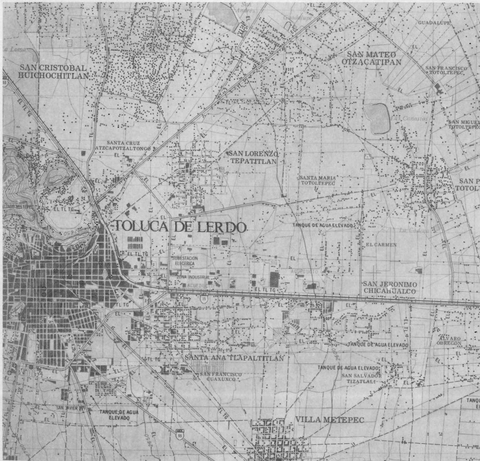
Toluca, Estado de México [1980]. Colección Cartográfica del Territorio Nacional, E14-A38 (detalle).