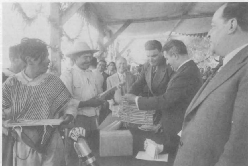
Entrega de títulos de propiedad a campesinos de Huichapan por el presidente Manuel Avila Camacho, Pachuca, Hidalgo, 1942.

La información está ordenada por estados de la República.